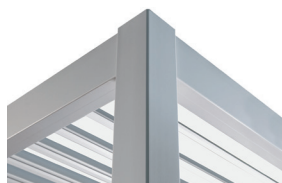
Skånska Byggvaror Suns, Pergola Aluminium 54-000036