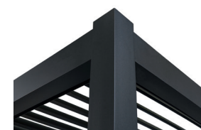
Dancover San Pablo