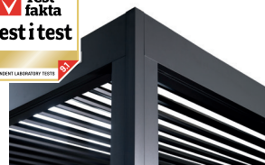
Pergolux Pergola S3