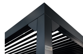
Arc E-commerce Pergola Premium